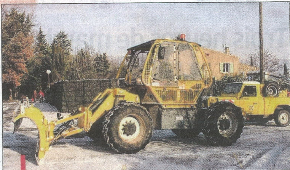
Les forestiers sapeurs de Peynier.