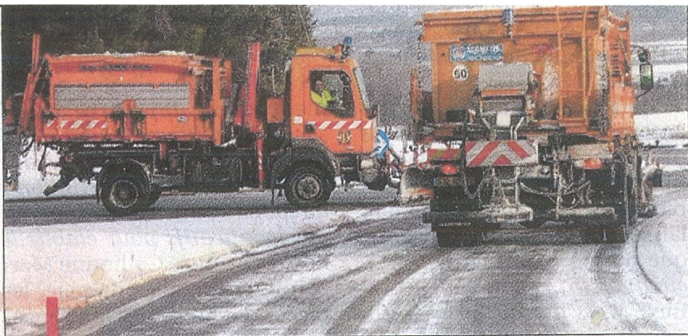
Les agents de la DIR 13.

Des flocons sont encore tombés dans la nuit de samedi à dimanche dans la vallée de l'Arc.